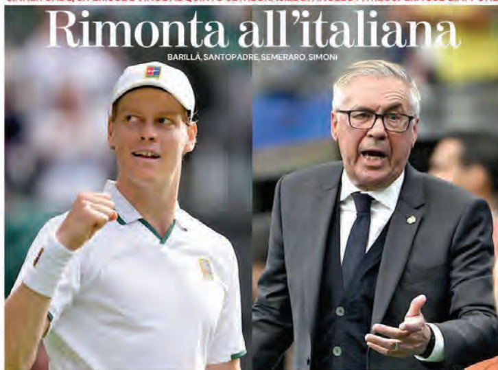
Jannik Sinner ha vinto a Wimbledon contro il serbo Kecmanovic. A destra il coach del Brasile Carlo Ancelotti. - PAGINE 32-37

SINNER CADE, SI FERISCE E VINCE AL QUINTO SET. IL BRASILE DI ANCELOTTI RECUPERA SUL GIAPPONE