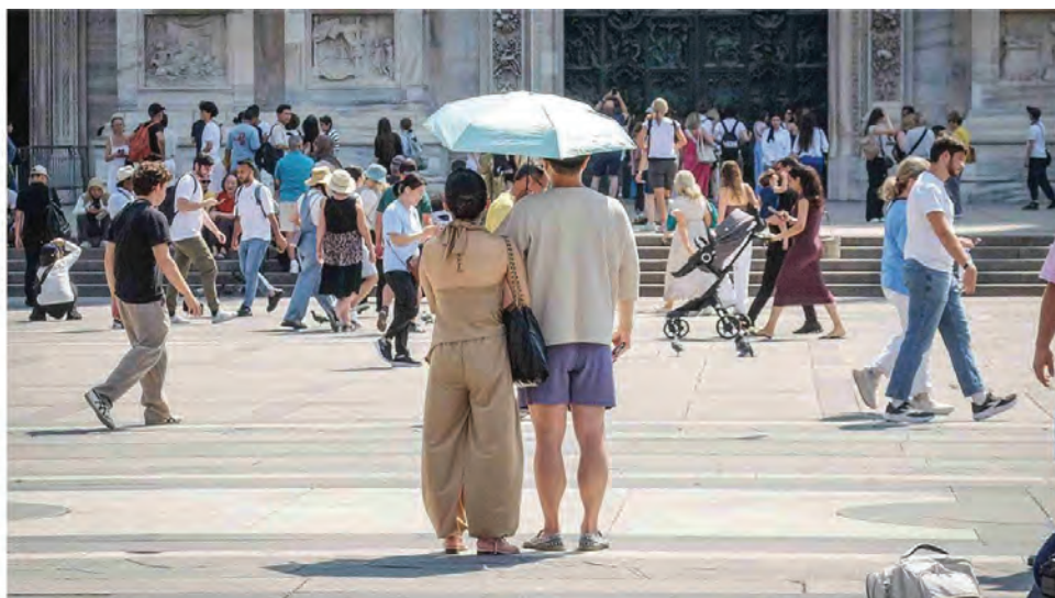
Cittadini e turisti cercano refrigerio dalle temperature record in piazza del Duomo, a Milano

Negli ultimi cinque giorni si sono registrate 400 chiamate al numero verde del Ministero. Al pronto soccorso i codici rossi sono cresciuti del 10%. Alcuni operai hanno dato vita allo "sciopero climatico"