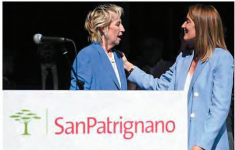
Letizia Moratti cofondatrice della Comunità di San Patrignano e Roberta Metsola, presidente del Parlamento europeo

Il gioco non va demonizzato ma gestito. Quando era vietato, proliferava la clandestinità, ora che è ammesso è possibile monitorarlo e intervenire per arginare comportamenti compulsivi. In particolare è il gioco on line che desta preoccupazione per le difficoltà di un effettivo controllo