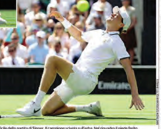
Il momento più difficile della partita di Sinner. Il campione scivola sull'erba. Nel riquadro il piede ferito