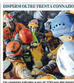
Un ragazzo salvato a più di 100 ore dal sisma

di Simone Canettieri e Tommaso Labate «Non è detto che non si possa superare questo altro grande tabù e avere un presidente della Repubblica che non sia di centrosinistra». La premier Giorgia Meloni apre il fronte Quirinale. E sull'ipotesi di un'alleanza con Roberto Vannacci dice: «Difficilmente puoi costruire qualcosa con qualcuno che palesemente vuole solo distruggere». alle pagine 14 e 15