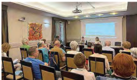
Un momento di un Corso di Alta Formazione

Proprio mentre si diradano le relazioni significative, anche per l'impatto delle tecnologie digitali, occorre creare e rafforzare reti di accoglienza e di sostegno. Una risposta di speranza