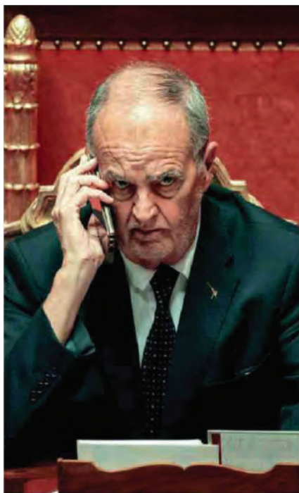
Banderina Roberto Calderoli