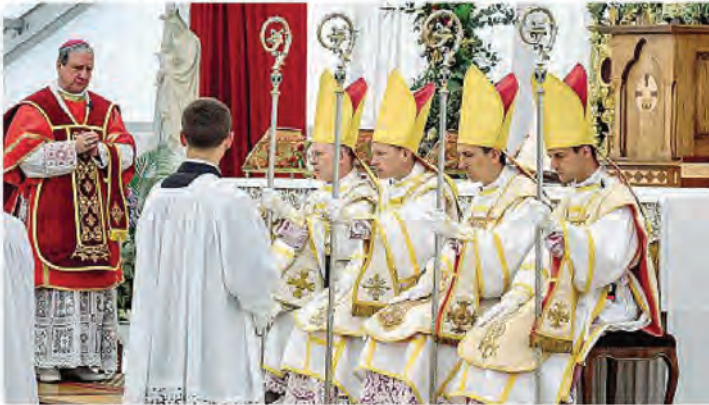
Uno dei momenti dell'ordinazione dei quattro vescovi lefebvriani in Svizzera. Una decisione che porterà alla scomunica

Lo strappo Ieri la cerimonia dei tradizionalisti in Svizzera, nonostante l'appello di Prevost. Perché scatta la scomunica