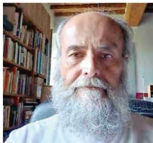
POLITICA SANITARIA, BIOETICA