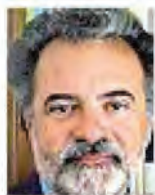
Chi è Claudio Mencacci è direttore di Neuroscienze e Salute mentale al Sacco di Milano

I numeri Negli incidenti, normalmente, alla guida ci sono più frequentemente i maschi