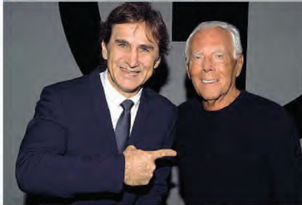
Alex Zanardi, scomparso venerdì a 59 anni, fotografato nel 2018 con Giorgio Armani, morto l'anno scorso a 91 anni