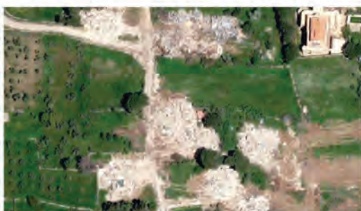
Una foto dall'alto delle case distrutte del villaggio di Yarun, nel Sud del Libano