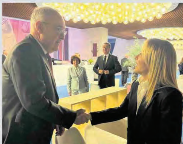
L'INCONTRO La premier Giorgia Meloni e il presidente della Confederazione svizzera, Guy Parmelin

ta dal governo italiano, è la rinuncia al rimborso in virtù di una clausola eccezionale inserita nell'accordo tra Italia e Svizzero sulle prestazioni sanitarie.