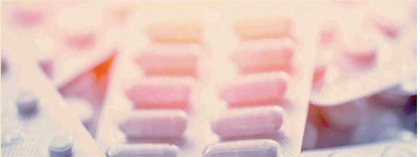
Corre la spesa. Nel 2025 la spesa farmaceutica potrebbe superare i 25 miliardi, erano 21,7 miliardi nel 2023 poi saliti a 23,7 miliardi nel 2024