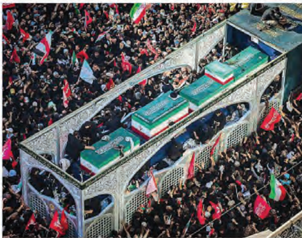
La folla circonda il feretro dell'ayatollah Ali Khamenei durante le celebrazioni dei funerali ieri nella città di Mashhad