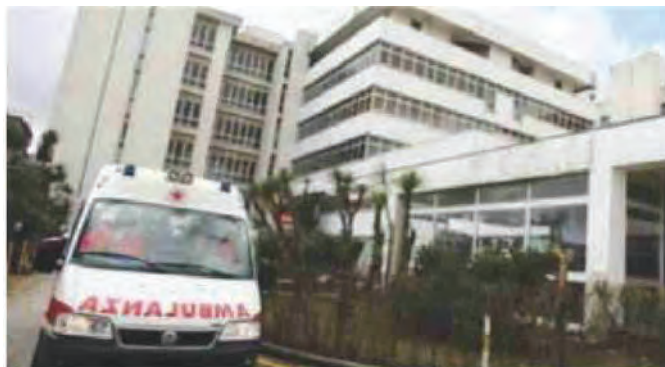
Napoli Il pronto soccorso dell'Ospedale Cardarelli