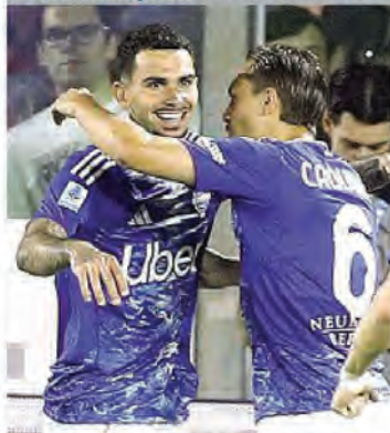
La festa dei giocatori del Como e della Roma dopo le vittorie contro Cremonese e Verona e l'ingresso in Champions

Corsa Champions Scontri a Torino, tifoso ferito: il derby iniziato in ritardo