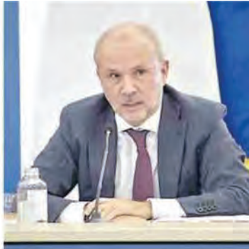
Sopra il ministro Orazio Schillaci e gli operatori di un'ambulanza

PER ANNI NESSUNO SI È OCCUPATO DEL PROBLEMA DEI GETTONISTI, CON LE REGIONI SIAMO IN COSTANTE CONTATTO ABBIAMO GARANTITO PIÙ FONDI PER PAGARE MEGLIO CHI LAVORA NEI PRONTO SOCCORSO, CODICI BIANCHI E VERDI DEVONO DIMINUIRE