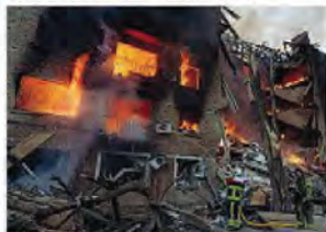
Droni Casa ucraina colpita dai droni russi. I primi soccorsi