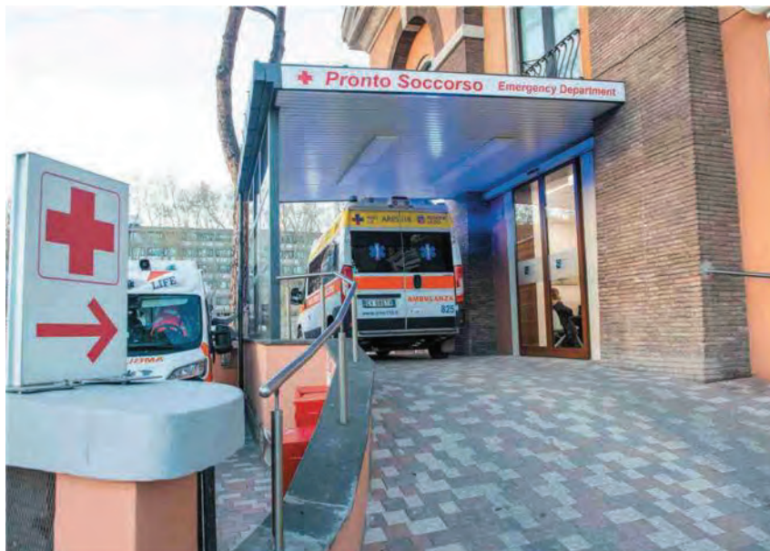
L'allarme L'emergenza si riscontra nei Pronto soccorso

sulenze, collaborazioni e convenzioni sono aumentate nell'Asl Roma 5 del 38% in un solo anno, passando dai 7 milioni e 148 mila euro del 2024 a 9 milioni e 867 mila euro del 2025 suddivisi tra circa 800 medici. Con picchi-record di 144 mila euro di retribuzione-extra per un primario otorino e 120 mila euro per un medico del Pronto soccorso. Il mese scorso l'Asl ha autorizzato il ricorso all'attività aggiuntiva dei medici dei Ps per «1700 ore al mese e un costo complessivo di euro 510.000» fino a giugno.