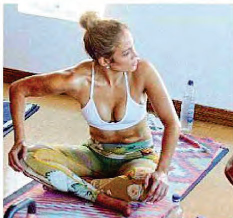
Jennifer Lopez, popstar, 57 anni il 24 luglio, si allena ogni giorno