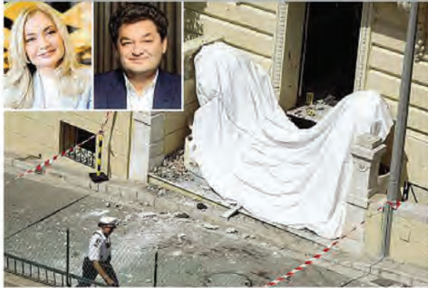
L'ingresso dell'abitazione dove è esplosa la bomba. Nel riquadro, l'oligarca ucraino Ermolaev e la moglie Anna