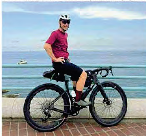
Il conduttore radiofonico Linus, 68, alterna la bici alla corsa