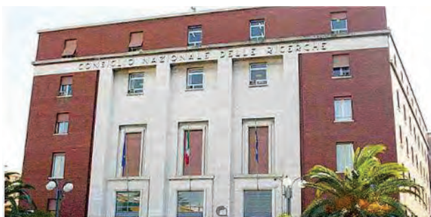
La sede del Consiglio nazionale delle ricerche, a Roma

La versione di Lenzi sconfessata dal direttore del dipartimento di Ingegneria Ict: lo strumento a comando ottico per la morte della donna malata di Sla costruito su richiesta del Tribunale di Firenze e costato alla Ausl circa 10mila euro