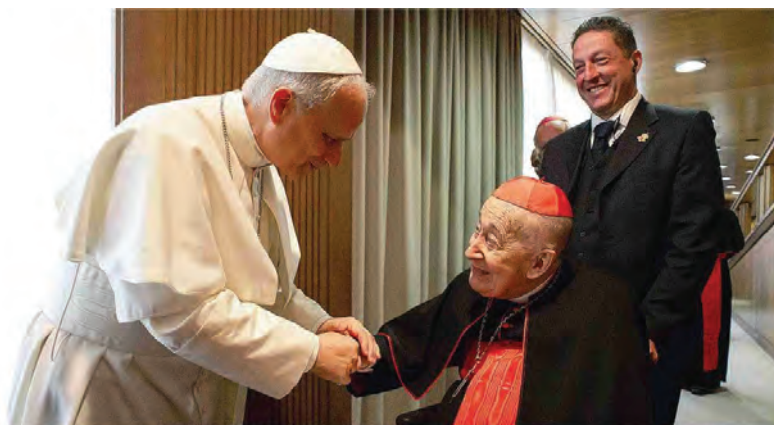
Leone XIV saluta il cardinale Camillo Ruini al termine dell'incontro con i cardinali il 10 maggio 2025