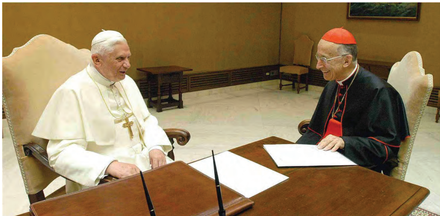
Benedetto XIV con il cardinale Camillo Ruini, all'epoca vicario generale del Papa per la città di Roma

Il porporato ha lasciato una traccia profonda nella Chiesa italiana. E ha chiamato i cattolici a essere sale e luce nel Paese, senza paura né timidezza: «Meglio contestati che irrilevanti»