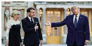
Emmanuel Macron e la moglie Brigitte accolgono a Versailles Donald Trump