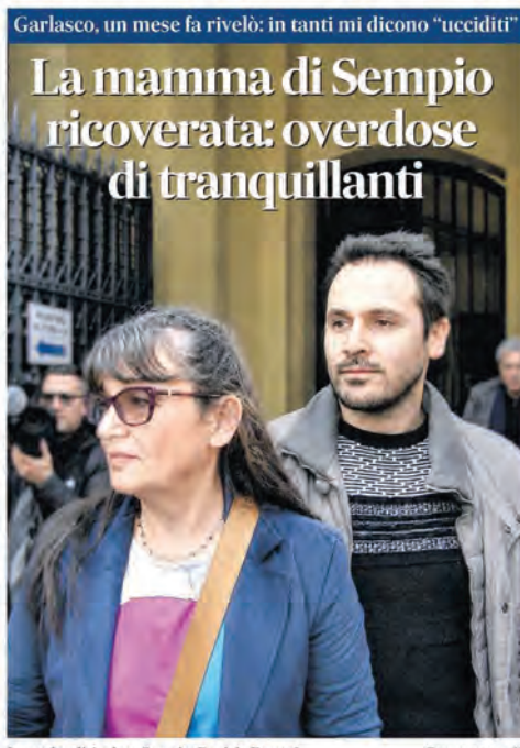
Garlasco, un mese fa rivelò: in tanti mi dicono "ucciditi"

NEW YORK Accordo Usa-Iran: riapertura di Hormuz e via le sanzioni all'Iran. Dalla nostra inviata a Evian Deana Sciarra e Paola alle pag. 2 e 3 e l'analisi di Andrew Spannausa pag. 26