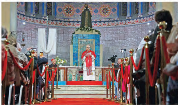
Leone XIV incontra la comunità cattolica alla Basilica di Nostra Signora d'Africa ad Algeri

Il Papa ad Algeri chiede che le fedi siano unite per riconciliare i popoli e le nazioni. Omaggio ai cristiani martiri E risponde pacato a Trump: non ho paura. Troppi innocenti uccisi, un'altra via rispetto alla guerra è possibile