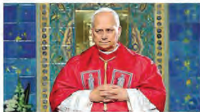
Leone XIV, 70 anni, ieri nella Basilica di Nostra Signora d'Africa, ad Algeri