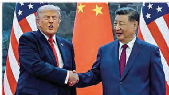
La stretta di mano fra il presidente americano Donald Trump, 79 anni, e il presidente cinese Xi Jinping, 72