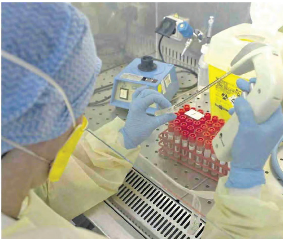
Analisi su alcuni campioni in uno dei laboratori del Policlinico Gemelli: strumentazione all'avanguardia per diagnosi precoci e ricerca d'eccellenza