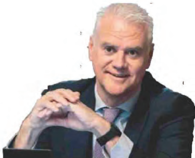
Paolo Zangrillo Il ministro per la Pubblica Amministrazione nel governo Meloni