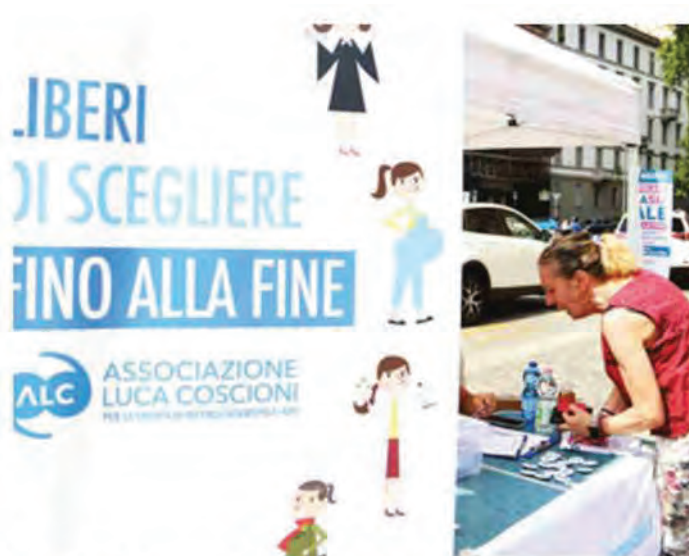
Raccolta di firme per la legge «Eutanasia legale»

In attesa della legge nazionale in Lombardia e Veneto si cerca una soluzione