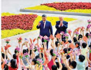
Donald Trump con Xi Jinping

PECHINO. Certe volte per capire i retroscena della diplomazia torna utile guardare ai dettagli. Ieri mattina, pur accogliendo con i massimi onori militari il presidente americano Trump nella Grande Sala del Popolo di Pechino, il rivale cinese Xi lo ha avvertito che se non gestirà con ocularità la questione di Taiwan, rischierà la guerra. Con servizi di LOMBARDI e MODULO da pagina 6 pagina 11, commento di BETTINI