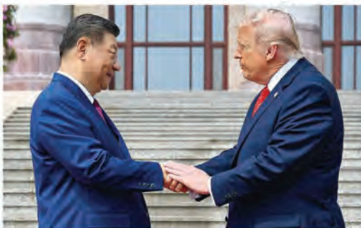
L'INCONTRO IN CINA Sorrisi e affari per Xi e Trump. Ma su Taiwan restano lontani

Lenzi, Musara e Pompo alle pag. 2,3 e 15