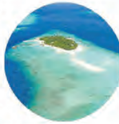
L'atollo di Vaavu