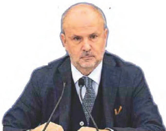
Orazio Schillaci Il ministro della Salute nel governo Meloni