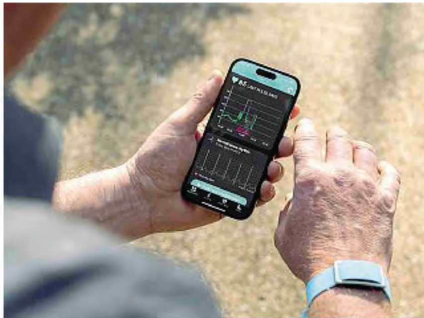
Dati sanitari Il braccialetto trasmette i dati su una app al medico del Policlinico Umberto I