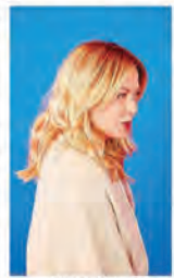
Giorgia Meloni