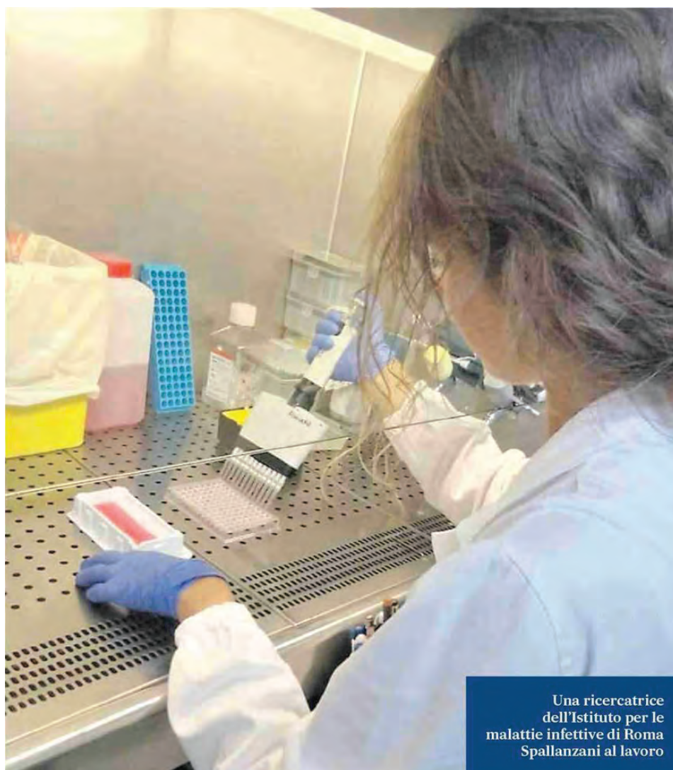
Una ricercatrice dell'Istituto per le malattie infettive di Roma Spallanzani al lavoro