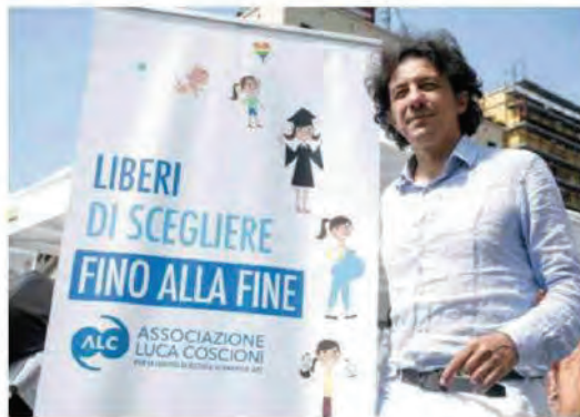
È stato seguito dall'Associazione Luca Coscioni

andarsene nel proprio letto, «dopo una lunga attesa». Il 66enne ha in un primo momento contattato Marco Cappato per chiedere aiuto ad andare a morire in Svizzera. Una volta ricevute le informazioni sulla possibilità di ottenere quell'aiuto in Italia, ha presentato richieste al Servizio sanitario.