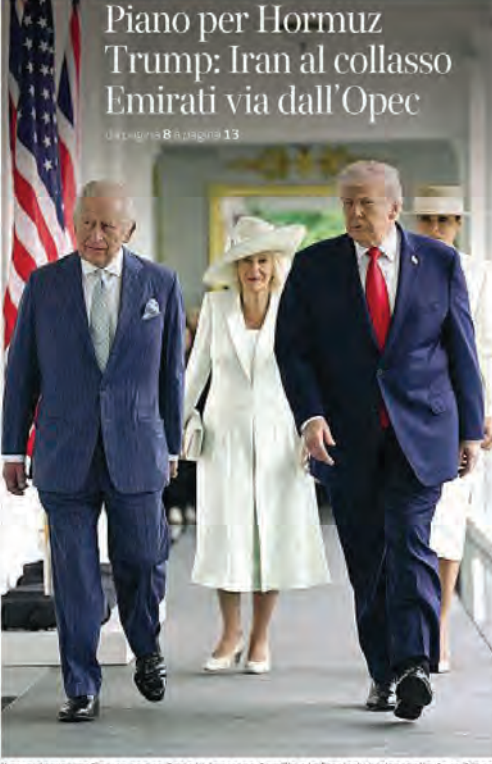
Il presidente Usa Trump con re Carlo III, la regina Camilla e la first lady Melania alla Casa Bianca

Piano per Hormuz Trump: Iran al collasso Emirati via dall'Opec di Luigi Ippolito alle pagine 8 e pagina 13 LA VISITA E LA RELAZIONE SPECIALE La missione del re Rucce con gli Usa Donald: bell'accento di Luigi Ippolito Missione compiuta. La magia della Corona, incarnata da re Carlo III, ha domato l'aggressività senza limiti di Trump e ridato smalto a una relazione speciale che aveva subito più di una picconata. alle pagine 12 e 13 L'EX CONSIGLIERE BOLTON «Teheran rinuncerà all'arma atomica solo con la forza» di Federico Fubini Il nucleare? «Non credo ai negoziati, serve un'azione militare. Altrimenti Teheran non rinuncerà all'atomica»: parla John Bolton, l'ex consigliere per la sicurezza nazionale di Trump. alle pagine 8 e 9