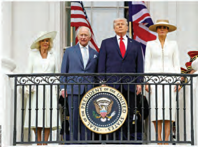
Re Carlo III e la consorte Camilla con il presidente Trump e la moglie Melania alla Casa Bianca