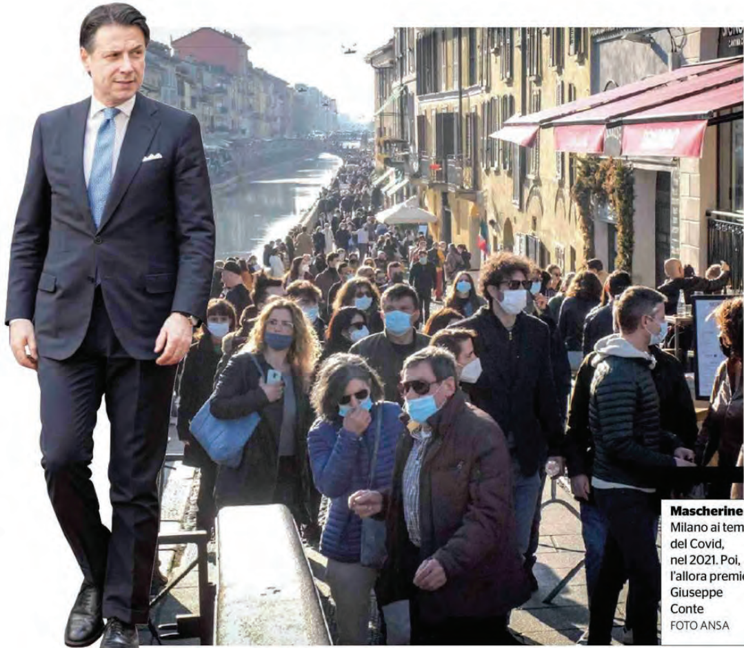
Mascherine Milano ai tempi del Covid, nel 2021. Poi, l’allora premier Giuseppe Conte