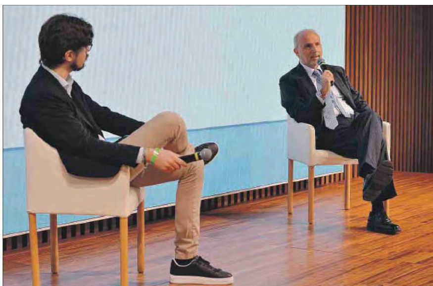
Il ministro della Salute Orazio Schillaci intervistato da Luca Roberto

“Sulle liste d'attesa ci ho messo la faccia. Stiamo migliorando. Oggi finalmente abbiamo una piattaforma di monitoraggio. Sono convinto che la nostra sia una buona legge e che, quando verrà applicata, metterà le regioni in competizione tra di loro per offrire un servizio migliore e tempi più brevi”