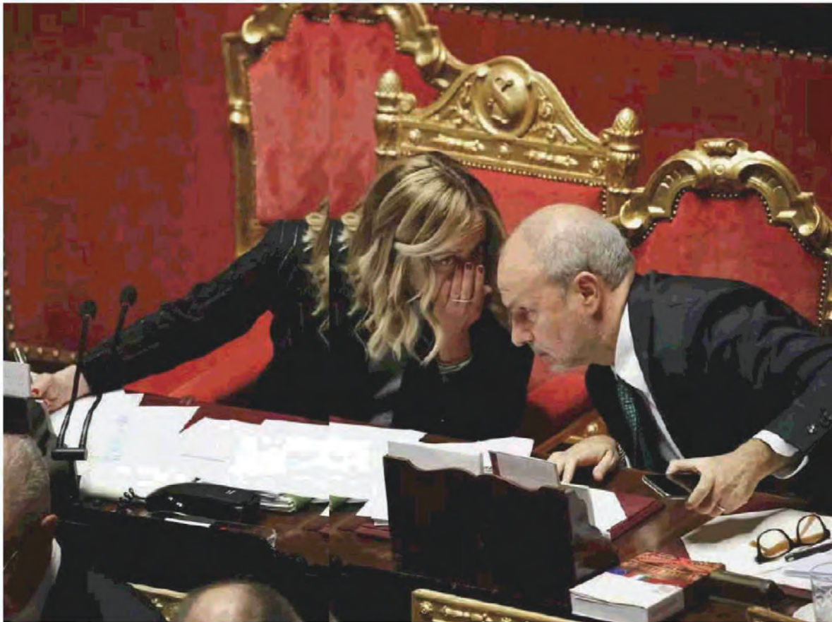
La presidente del Consiglio Giorgia Meloni con il ministro della Salute Orazio Schillaci

sabbie mobili elettorali hanno una caratteristica: non inghiottono all'improvviso. Lo fanno lentamente. Un passo dopo l'altro. Una riforma rinviata. Una mediazione al ribasso. Un veto accettato. Un conflitto evitato. Finché è troppo tardi e si sprofonda.