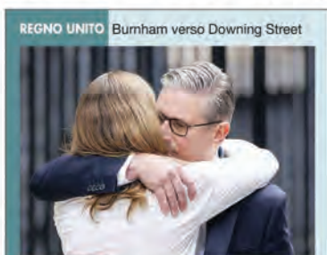
REGNO UNITO Burnham verso Downing Street

L'appello del Papa in visita al Programma alimentare mondiale: «Si nutrono più le guerre delle persone». Intanto le incognite su fondi e fabbriche rallentano la corsa della difesa