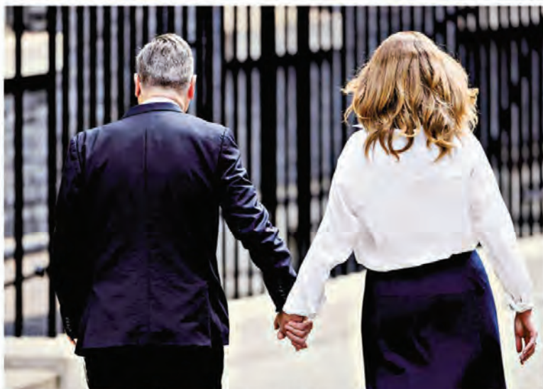
Keir Starmer con la moglie Victoria mentre si allontanano da Downing Street

In esattamente dieci anni, la Brexit ha triturato sei primi ministri britannici e ora toccherà al settimo confrontarsi con quella infausta decisione, che ha trasformato il numero 10 di Downing Street, storico simbolo di stabilità, in una porta girevole. Al posto del laburista Keir Starmer arriva un altro laburista, Andy Burnham, con la promessa di interrompere la giostra del potere, «invertire la rotta» del caos politico e del declino economico, restituire al Labour un programma più marcato di sinistra.