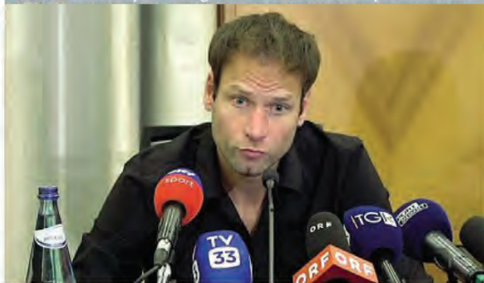
La conferenza stampa di Alex Schwazer, il marciatore altoatesino di 41 anni e campione olimpico ancora accusato di doping