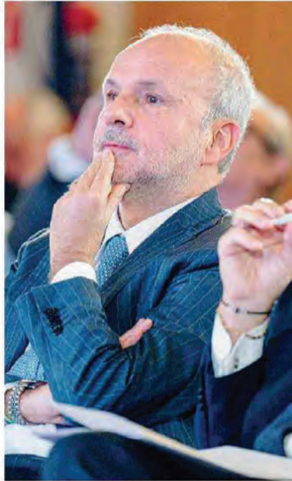
Il ministro Orazio Schillaci

DI FRONTE alla spesa farmaceutica fuori controllo - 4,7 miliardi lo sfioramento del tetto fissato per il 2025 agli acquisti diretti delle Regioni - l'Aifa ha avviato una revisione drastica del Prontuario che stabilirebbe, per classi di farmaci, la rimborsabilità solo al prezzo del prodotto che costa meno, anche quando le molecole sono diverse