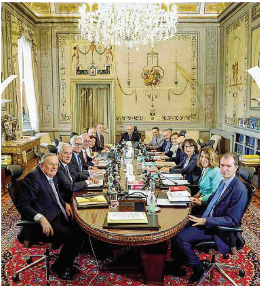
24 febbraio 2026 | giudici della Corte costituzionale durante la camera di consiglio a Palazzo della Consulta