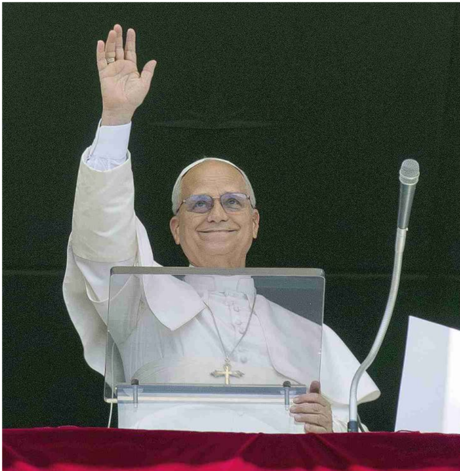
Il Papa affacciato alla finestra del Palazzo Apostolico per il Regina Caeli di domenica

Il documento sarà presentato lunedì prossimo alla presenza dello stesso Pontefice, che l'ha firmato nel giorno dell'anniversario della Rerum novarum . Avrà al centro il tema della dignità umana