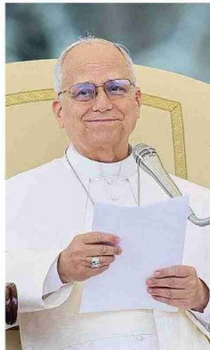
Papa Leone XIV