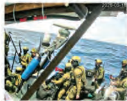
L'Idf su una barca della Flotilla

Israele blocca le imbarcazioni della Global Sumud Flotilla al largo di Cipro. Decline di attivisti diretti a Gaza, tra i quali quattordici italiani, fermati dai soldati dell'Idf. Il ministro degli Esteri Tajani ne chiede il rilascio immediato. La segretaria del Pd Schlein denuncia «l'ennesimo atto di pirateria in acque internazionali». di CANDITO e TONACCI alle pagine 4 e 5