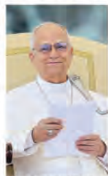
Papa Leone XIV

Si intitola Magnifica humanitas la prima lettera enciclica di papa Leone XIV, dedicata alla custodia della persona umana nel tempo dell'intelligenza artificiale. Il documento, firmato il 15 maggio nel 135° anniversario della Ierem Novarum di papa Leone XIII, sarà presentato il 25 maggio alle 11,30 nell'Aula del Sinodo, alla presenza dello stesso Papa. L'annuncio è stato dato ieri dalla Sala Stampa della Santa Sede. Il movimento si colloca in una scia tematica precisa: quella dell'impegno sociale del magistero della Chiesa.