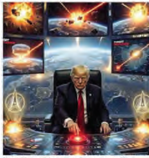
Donald Trump, 79 anni, in un'immagine con l'AI