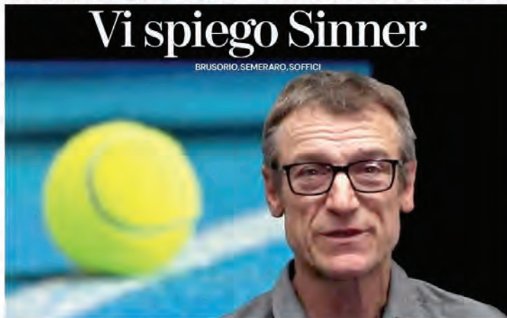
Mats Wilander, 61 anni, svedese: ex numero uno del tennis mondiale è anche storica voce di Eurosport — PAGINE 52 E 53

WILANDER, EX NUMERO UNO DEL TENNIS. JANNIK A PARIGI DEVE FARE ATTENZIONE, TERRA TRADITRICE